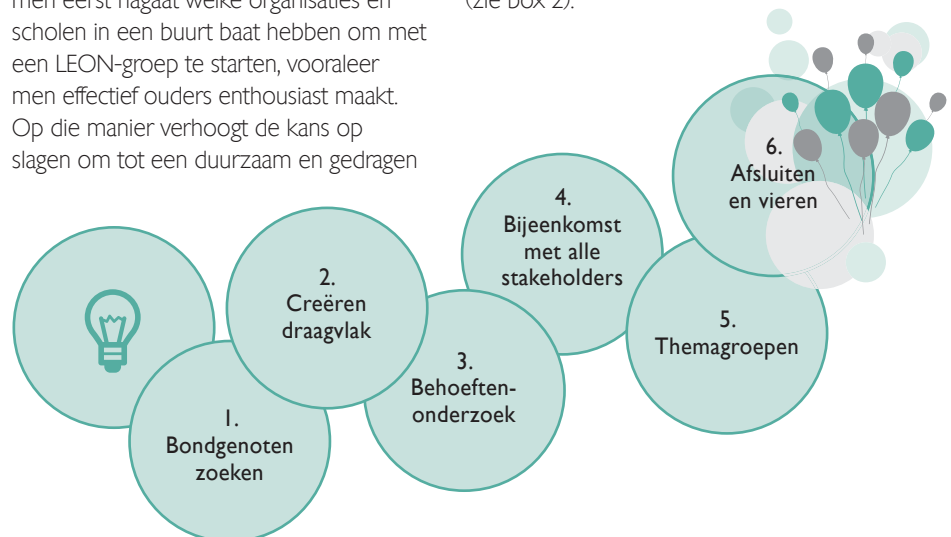
Figuur 1. Stappenplan voor het opstarten van een LEON-groep

Op basis van onze ervaringen ontwikkelden we een stappenplan (zie figuur 1). Het stappenplan zorgt ervoor dat elk LEON-project zo veel als mogelijk inspeelt op de noden van alle betrokkenen bij de school. Uitgangspunt van het stappenplan is dat men eerst nagaat welke organisaties en scholen in een buurt baat hebben om met een LEON-groep te starten, vooraleer men effectief ouders enthousiast maakt. Op die manier verhoogt de kans op slagen om tot een duurzaam en gedragen