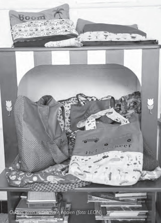
Ouders leren verteltassen naaien